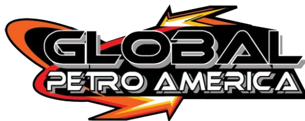
Gambar 2.2. Logo Global Petro America (Data Perusahaan)

Pada tahun 1999, Global Petroleum Ltd mengakui PT. Global Gemilang Sukses sebagai perusahaan bonafide dan mereka mengangkat PT. Global Gemilang sebagai distributor eksklusif dalam bidang pelumas industri. PT. Global Gemilang Sukses kemudian mengembangkan produk mereka sendiri yang telah diformulasikan oleh Global Petroleum Ltd yaitu Global Petro America dan Powerlube.