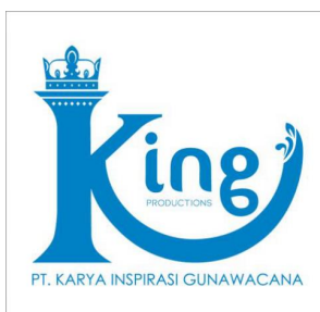
Gambar 2.1. Logo King Productions ( King Biography , 2019)

Seiring perkembangannya, King Productions menyediakan banyak jasa seperti penulisan cerita, pembuatan storyboard , coloring , translating , dan juga penyuntingan gambar hingga bahasa. Perusahaan ini mengerjakan webtoon dari berbagai genre dan mempunyai sebuah visi untuk mengembangkan komik serta memperkenalkan komikus Indonesia hingga ke luar negeri. Beberapa webtoon orisinal yang telah berhasil dikerjakan oleh King Productions adalah PDKT dan juga Sugar Daddy serta ada juga perancangan maskot Comico seperti Miko-chan . Selain itu, King Productions juga mempunyai sebuah misi berupa meningkatkan konten berkualitas tinggi melalui layanan dan produksi berskala global. Berikut merupakan logo dari perusahaan ini.