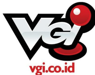
Gambar 2.2. Logo Video Game Indonesia (Dokumentasi Perusahaan)