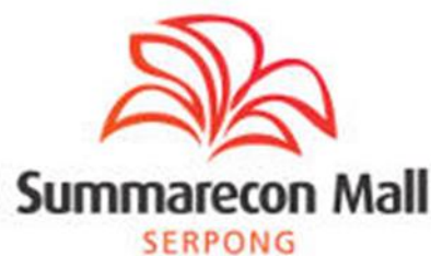
Gambar 2.1.1 Logo Summarecon Mall Serpong

PT. Summarecon Agung Tbk (Summarecon) berdiri tanggal 26 November 1975 dan pbulan September tahun 1976 mulai mengembangkan kawasan perumahan seluas 10 ha di kawasan Kelapa Gading. Pengembangan kawasan residential ini diikuti dengan pengembangan kawasan ekonomi dengan dibangunnya ruko di sepanjang jalan boulevard Kelapa Gading. Kawasan kelapa gading juga dilengkapi oleh pusat hiburan dengan didirikannya Summarecon Mall Kelapa Gading pada bulan maret tahun 1990. Kesuksesan ini mendorong PT Summarecon Agung untuk mengembangkan kawasan Serpong, Tangerang. Seiring dengan pengembangan kawasan residensial, Summarecon Serpong juga dilengkapi oleh Sentra Gading Serpong sebagai pusat bisnis yang terdiri dari Salsa Food City, Pasar Modern Sinpasa, dan Summarecon Mall Serpong. Ketiganya berada dibawah naungan PT Lestari Mahadibya.