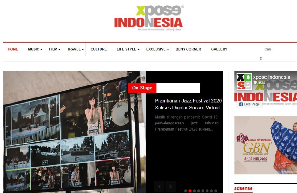
Gambar 2.2 Portal Media Xposeindonesia.com