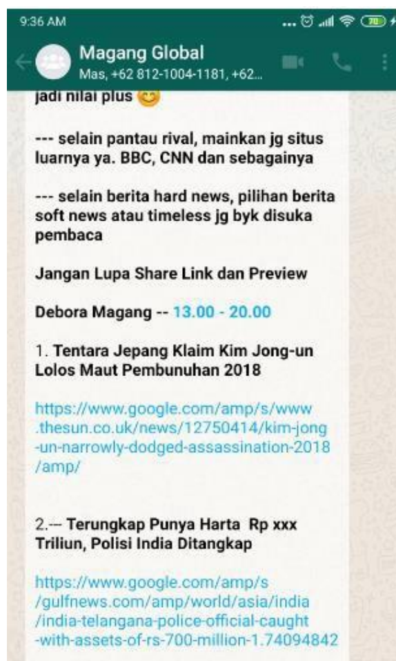
Gambar 3.1 Tangkapan Layar Penugasan Kepada Penulis Melalui Whatsapp

Penulis harus membuat artikel sebanyak dua halaman agar dapat diterbitkan. Jika hanya satu halaman, penulis harus mencari berita atau artikel lain yang mempunyai kesinambungan dari artikel yang pertama. Selain memberikan arahan dengan memberikan link berita kepada penulis, editor juga memberikan pekerjaan liputan online atau daring.