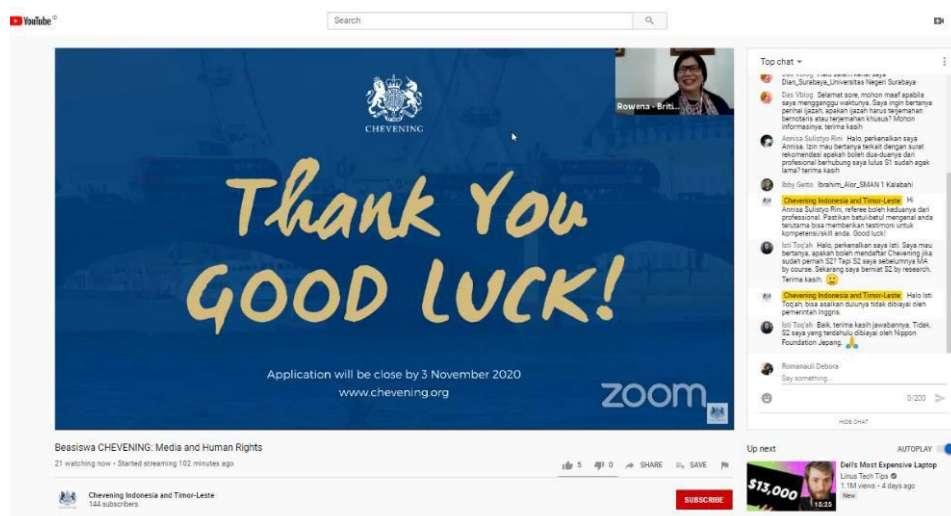
Gambar 3.5 Tangkapan Layar Liputan Melalui Youtube

Gambar 3.2 merupakan salah satu contoh tangkapan layar dari liputan yang dilakukan secara virtual atau daring. Liputan ini membahas mengenai aplikasi bernama Lapor COVID-19. Semua liputan tidak dapat bertanya, karena kolom pertanyaan hanya bisa dilakukan oleh orang-orang tertentu.