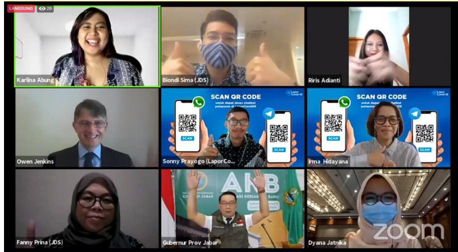
Gambar 3.4 Tangkapan Layar Liputan Melalui Zoom

Untuk foto halaman judul, penulis mencari foto yang sesuai dengan topik, yang bertanda AP atau AFP. Jika tidak ada, maka penulis mengambilnya dari situs gratis seperti Pixabay atau Unsplash.