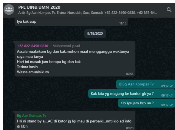
Gambar 1.3 Percakapan mentor soal jam masuk kerja.

Setelah mendapatkan jawaban, penulis diarahkan untuk datang ke kantor dengan menyerahkan curriculum vitae (CV) pada tanggal 17 September. Kemudian penulis juga dipersilakan menunggu panggilan masuk kerja pada tanggal 18 September sebagai karyawan kerja magang di Kompas TV Jambi .