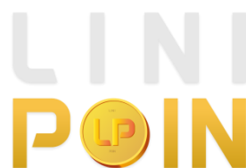
Gambar 2.4. Logo CMS LINIPOIN