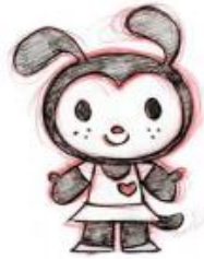
Gambar 2.4. Contoh gambar tokoh Iconic ( Creating Characters with Personality , 2006 )

Tokoh Iconic memiliki bentuk yang sederhana dan menarik namun tidak terlalu ekspresif. Hello Kitty dan Mickey Mouse merupakan contoh dari karakter dengan jenis Iconic .