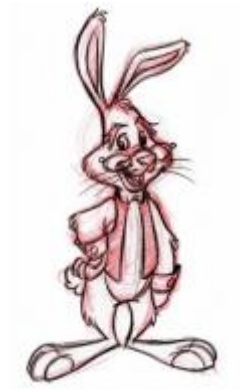
Gambar 2.7. Contoh gambar tokoh Comedy relief ( Creating Characters with Personality , 2006)

Tidak dirancang dalam penggambaran humor layaknya tokoh Broad , namun tokoh Comedy relief mampu menyampaikan humor melalui akting dan dialog.