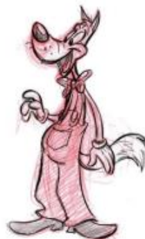
Gambar 2.6. Contoh gambar tokoh Broad ( Creating Characters with Personality , 2006)

Dibandingkan dengan jenis Iconic dan Simple , Tokoh Broad memiliki lebih banyak ekspresi. Dirancang untuk keperluan secara luas dan kartun. Ciri-ciri tokoh Broad yaitu memiliki mata dan mulut yang besar yang berpengaruh kepada ekspresi dalam penyampaian humor.