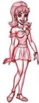
Gambar 2.8. Contoh gambar tokoh Lead character ( Creating Characters with Personality , 2006)