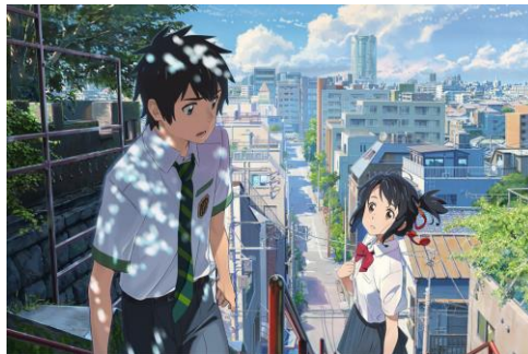
Gambar 2.13. Your Name , film animasi untuk usia 13-17+ tahun (Comix Wave Films, 2016)

Tokoh yang dibuat untuk target usia 14-18+ sudah jauh lebih sempurna dari segi proporsi tubuh, warna dan detail. Biasanya tokoh dibuat menyerupai wujud yang ada di dunia nyata.