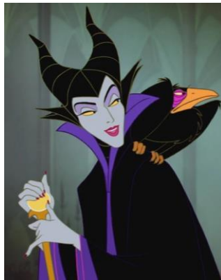
Gambar 2.16 Contoh tokoh Triangles , Maleficent (2012) ( https://disney.fandom.com/wiki/Maleficent )

Bentuk segitiga dapat melambangkan tokoh yang menyeramkan, dan mencurigakan. Segitiga memiliki siku yang tajam di setiap sudutnya, membuat sebuah tokoh yang menggunakan bentuk segitiga cenderung terlihat sebagai tokoh yang jahat (hlm.32-35).