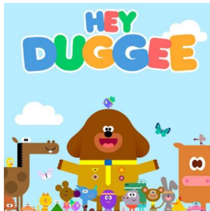
Gambar 2.10. Hey Duggee , film animasi untuk usia 2-5 tahun (Studio AKA, 2014)

Pada rentang usia ini biasanya tokoh yang dibuat cenderung memiliki mata yang besar dengan badan yang pendek. Warna yang digunakan pada tokoh tampak cerah dan bentuk tokoh dibuat sederhana.