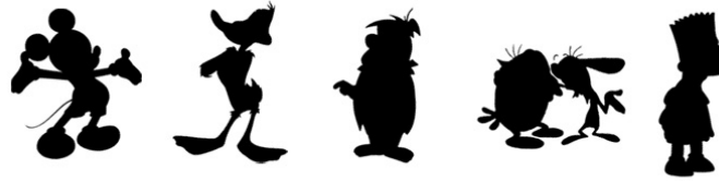
Gambar 2.17. Contoh gambar Siluet