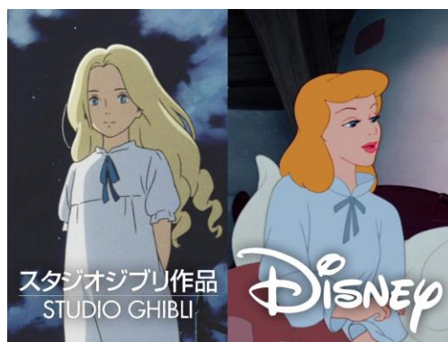
Gambar 2.3. Perbandingan gaya gambar Studio Ghibli dan Disney