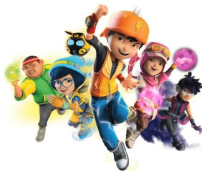
Gambar 2.12. Boboiboy , film animasi untuk usia 7-12 tahun (Animonsta Studio, 2011)

Tokoh yang dibuat untuk target usia 9-13 tahun sudah digambarkan lebih realistic dan memiliki lebih banyak detail. Proporsi tubuh dan warna yang digunakan juga lebih banyak. Hal tersebut dikarenakan umur 9-13 tahun adalah umur dimana anak tumbuh menjadi remaja, dan gaya gambar yang diinginkan juga berubah.