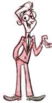
Gambar 2.5. Contoh gambar tokoh Simple ( Creating Characters with Personality , 2006)