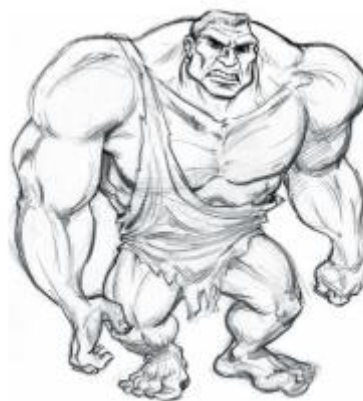
Gambar 2.9. Contoh gambar tokoh Realistic ( Creating Characters with Personality , 2006)

Tingkatan tertinggi dari segi realisme. Berbentuk fotorealis namun tetap menampilkan segi karikatur dalam desainnya. Biasa digunakan pada tokoh komik dan animasi yang berbasis grafik (hlm.18-20).