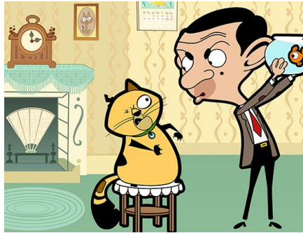
Gambar 2.2. Contoh gambar tokoh yang menarik, Mr.Bean (2002)

( https://www.tigeraspect.co.uk/productions/animation-childrens/mr-bean-the-animated-series/ )