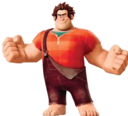
Gambar 2.15. Contoh tokoh Square , Wreck-it Ralph (2012) ( https://wreckitralph.fandom.com/wiki/Wreck-It_Ralph_(character) )

Sebuah kotak biasanya digunakan untuk menggambarkan karakter yang solid dan dapat diandalkan. Penggunaan bentuk dasar kotak dapat mempengaruhi penampilan tokoh yang terkesan menjadi gagah dan kuat dan tegas.