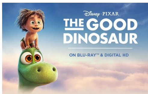
Gambar 2.11. The Good Dinosaur , film animasi untuk usia 7-9 tahun (Walt Disney Pictures, 2015)