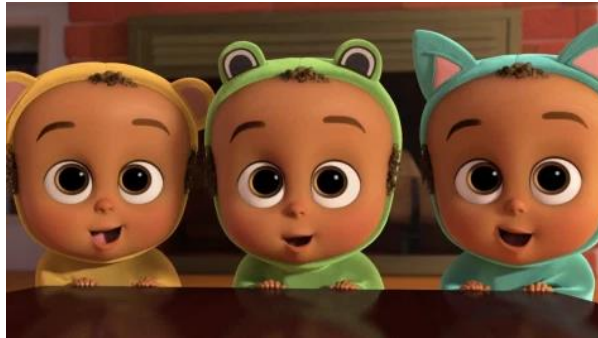
Gambar 2.14. Contoh tokoh Circle , The Boss Baby (2017) ( https://michaelbliss.co/2017/04/06/the-boss-baby-movie/ )