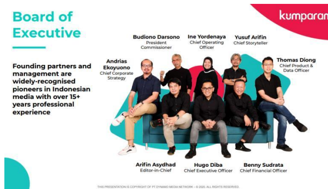
Gambar 2.4 Komisaris dan Direksi Kumparan