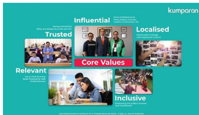
Gambar 2.3 Core Values Kumparan

Dalam Company Profile tersebut juga dicantumkan beberapa nilai yang diterapkan oleh Kumparan, antara lain: