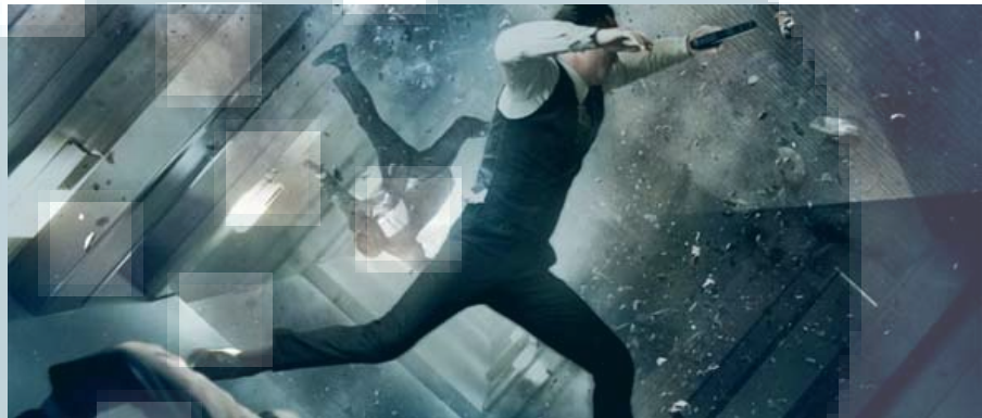
Gambar 2.4. Contoh Pengaplikasian Canted

Angle ini dibuat dengan memiringkan kamera ke satu sisi, menciptakan sebuah garis miring atau horizon miring. Angle ini digunakan untuk membuat kesan yang menegangkan dan berbahaya. Biasanya digunakan paling efektif dalam film horror ataupun thriller .