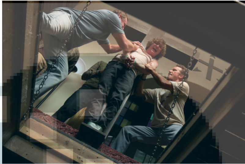
Gambar 2.2. Contoh Pengaplikasian Low-Angle Camera

( http://www.digitalspy.co.uk/movies/news/a332333/red-state-kevin-smith-thriller-gets-red-band-trailer.html.jpg )