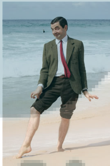
Gambar 2.6. Contoh Pengaplikasian Full Shot

Full shot yaitu dengan menyorot karakter secara keseluruhan dari kepala hingga kaki, tanpa terpotong sedikitpun. Teknik ini digunakan untuk memperlihatkan tampilan fisik dari si karakter kepada penonton.