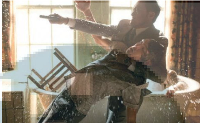
Gambar 2.7. Contoh Pengaplikasian Medium Shot