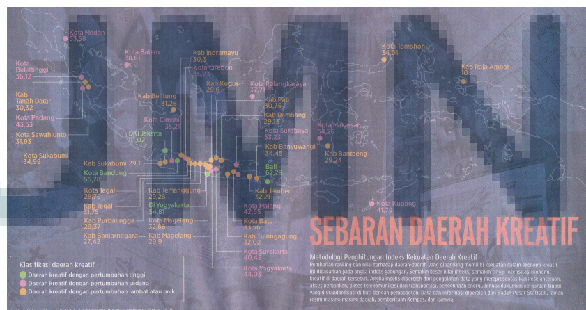
Gambar 1.1 Sebaran Daerah Kreatif (Koran Kompas, 2014)

Pada harian kompas tanggal 27 Juni 2014, disebutkan bahwa Jakarta termasuk dalam salah satu sebaran daerah kreatif dengan pertumbuhan yang tinggi. Kekuatan dalam ekonomi kreatif Jakarta adalah 91,02. Semakin tinggi nilai indeks, semakin tinggi intensitas ekonomi kreatif di daerah tersebut.