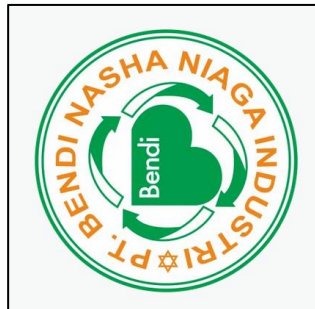
Gambar 2. 1 Logo PT. Bendi Nasha Niaga Industri

Seiring berkembangnya kebutuhan konsumen dan industri, PT. Bendi Nasha Niaga Industri lebih fokus pada bidang jasa angkutan baik kimia, B3, Limbah B3 dan logistik serta lebih fokus dalam pengembangan pengelolaan limbah B3 dan Non B3 baik medis, limbah padat, cair, minyak maupun Non B3.