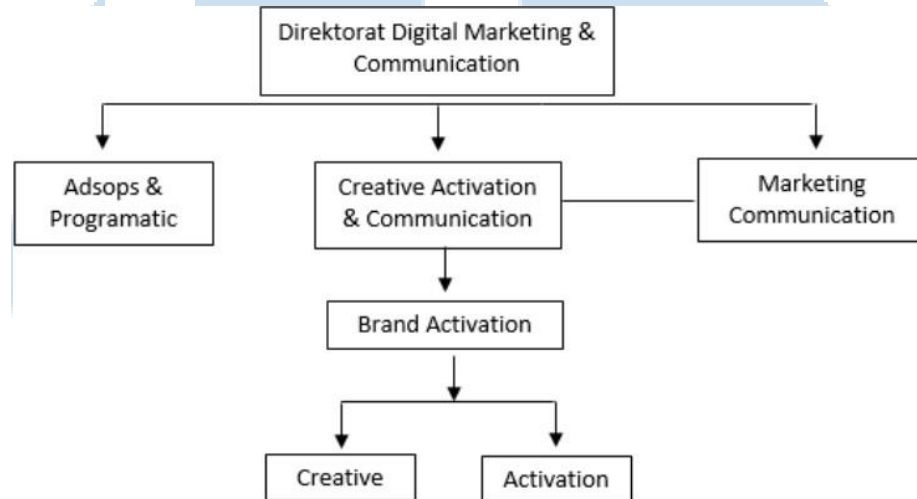
Tabel 2. 1 Struktur Organisasi Digital Marketing & Communication MNC Portal