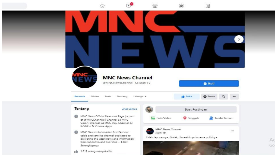
Gambar 2.3 Tampilan Facebook MNC NEWS