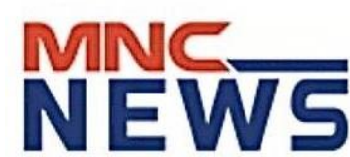
Gambar 2.4 Tampilan Logo MNC NEWS

Logo MNC NEWS memiliki bentuk yang sederhana, solid dan mudah diingat dengan perpaduan warna yang menarik. Jargon atau slogan dari MNC News sendiri yaitu “The Most Comprehensive & Informative News Channel” yang artinya, MNC News selalu berkomitmen kepada publik untuk menyajikan informasi yang aktual, tajam, dan menarik sesuai dengan kebutuhan masyarakat akan informasi yang tersebar.