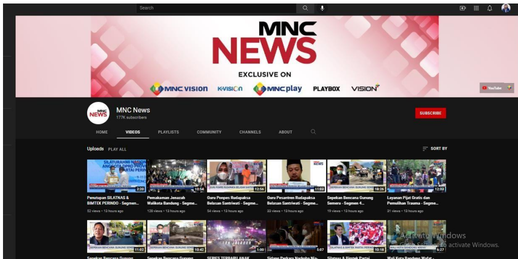
Gambar 2.2 Tampilan Youtube MNC NEWS