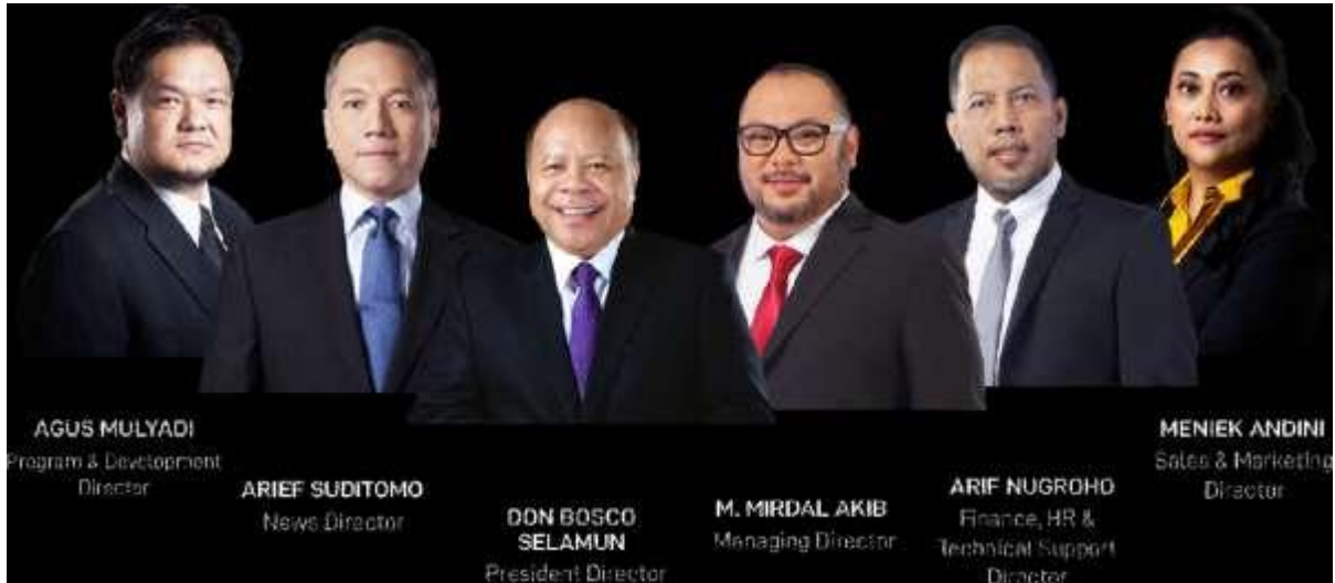
Gambar 2.1 Susunan Redaksi Metro TV