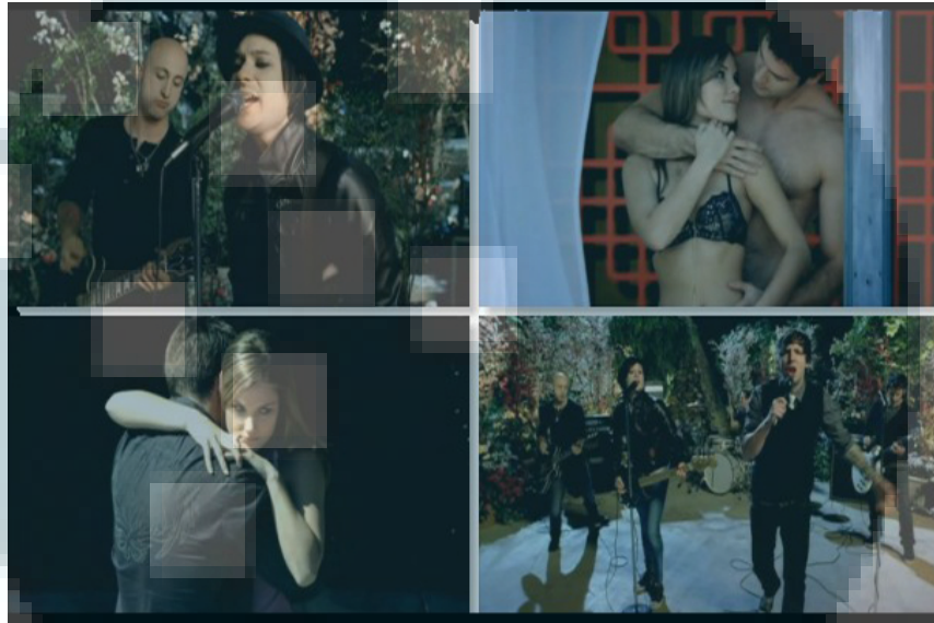
Gambar 2.5. Simple Plan – Your Love is a Lie ( http://www.youtube.com/watch?v=XAbcgmwq3EU ,2014)