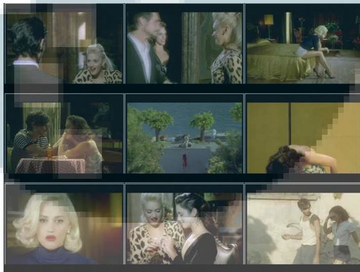
Gambar 2.3. Gwen Stefani – Cool ( http://www.youtube.com/watch?v=TGwZ7MNtBFU ,2014)

Contoh band atau artis yang memakai video musik narasi: