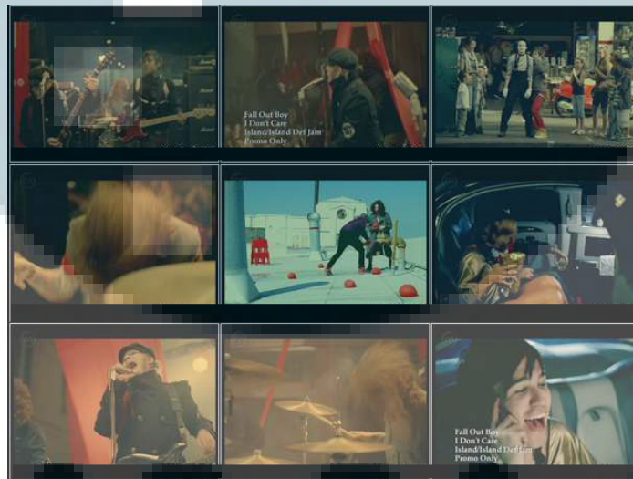
Gambar 2.4. Fall Out Boy – I Don't Care ( http://www.youtube.com/watch?v=Alh6iIvVN9o ,2014)

Contoh Band menggunakan Video Musik jenis ini: