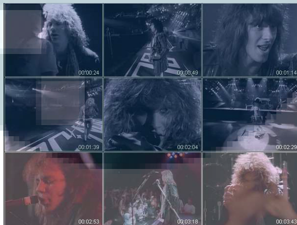
Gambar 2.2. Bon Jovi – Livin' On A Prayer ( http://www.youtube.com/watch?v=IDK9QqIzhwk ,2014)

Dari contoh video diatas, biasanya menggunakan kamera dengan sudut-sudut luas dan berulang, serta hanya menampilkan band yang sedang bermain. Jenis video ini biasanya menampilkan pula setiap member sedang bermain atau berinteraksi.