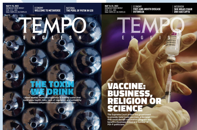
Gambar 2.3 Tempo Inggris

U N I V E R S I T A S M U L T I M E D I A N U S A N T A R A