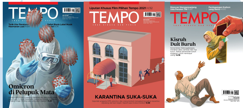
Gambar 2.2. Majalah Tempo mingguan