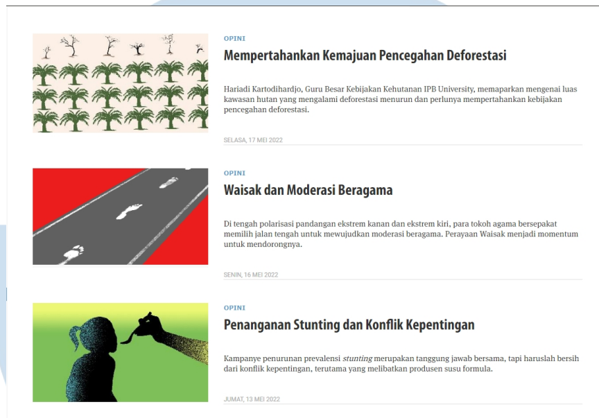
Gambar 2.3 Potfolio Perusahaan Tempo