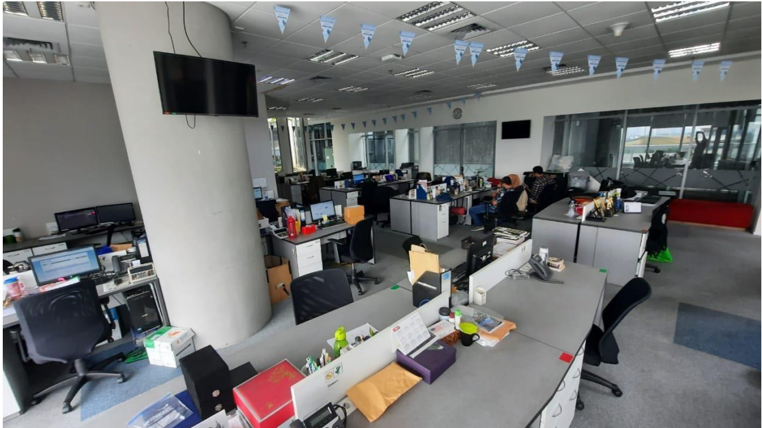
Gambar 2. 3 Kantor Kompas TV