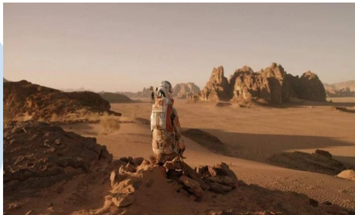
Gambar 2.1 Long Shot

Long shot adalah jenis shot yang mencakup seluruh tubuh seseorang dalam kaitannya dengan lingkungan sekitar. Biasanya diambil dari jarak yang cukup jauh dari subjek.