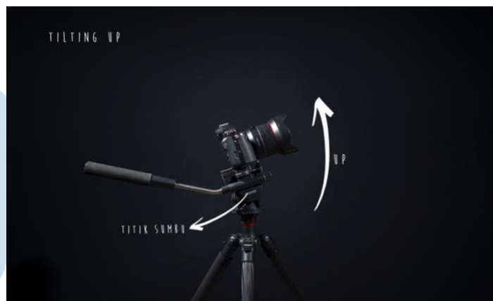
Gambar 2.10 Tilting

Sama halnya dengan Pan . Bedanya, tilt adalah perpindahan kamera secara vertikal, dari atas menuju ke bawah ataupun sebaliknya. Dalam teknik ini, kamera harus tertahan pada titik tertentu dengan cara menggunakan tripod atau alat lain.