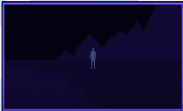
Gambar 2.5 Establishing Shots

Salah satu jenis shot yang berfungsi untuk mendefinisikan ruang atau tempat.