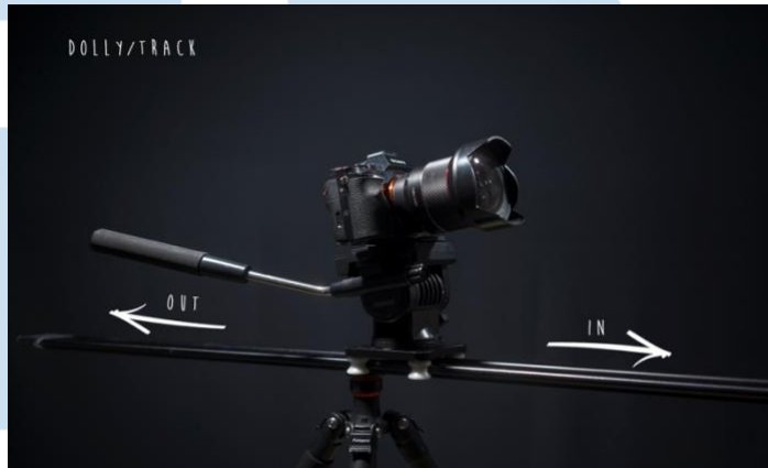
Gambar 2.11 Move In/Out

memberikan pengalaman visual berbeda kepada penonton lewat efek dan pergerakan yang tepat.