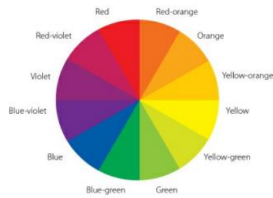
Gambar 2.13 Color Wheel