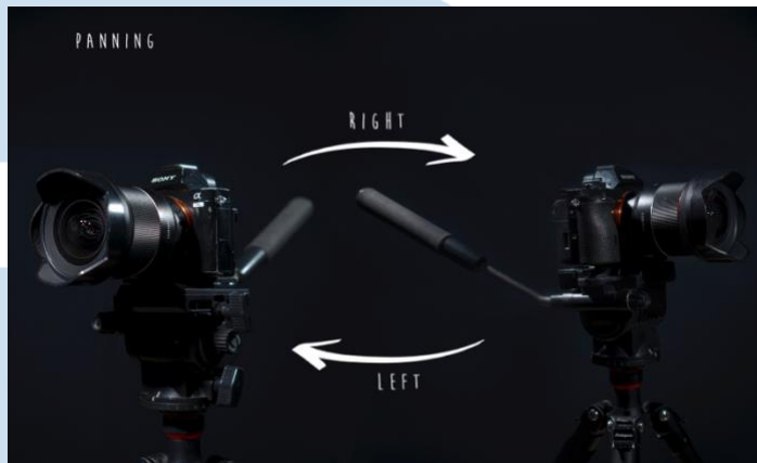
Gambar 2.9 Panning