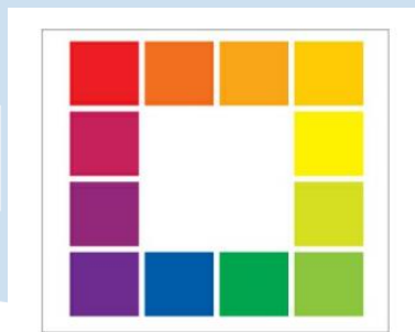
Gambar 2.14 Hue

Pembeda satu warna dengan warna lainnya, hue adalah nama generik dari warna