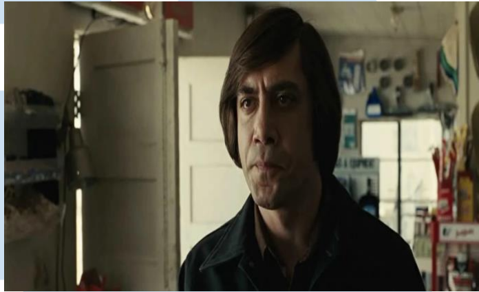
Gambar 2.2 Medium Shot

Medium Shot memperlihatkan bagian subjek secara lebih jelas. Biasanya digunakan untuk menunjukkan emosi subjek.