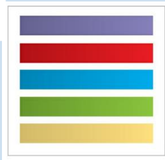
Gambar 2.16 Saturation

Setara dengan tingkat kecerahan. Garis dengan intensitas tinggi adalah warna cerah sedangkan warna dengan intensitas rendah adalah warna kusam. Dua warna bisa memiliki garis yang sama tetapi memiliki intensitas yang berbeda.