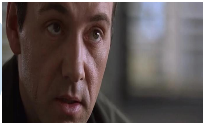
Gambar 2.3 Close-Up

Close Up adalah jenis shot yang digunakan untuk memberi penekanan terhadap emosi dan detail yang ingin diperlihatkan dalam suatu frame .