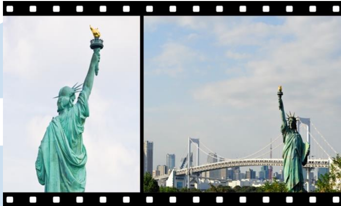
Gambar 2.6 Reverse-angle Shots