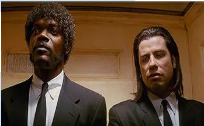
Gambar 2.7 Two Shot

Two Shot jenis shot yang memperlihatkan dua karakter dalam satu frame . Biasanya digunakan untuk adegan interaksi antara dua karakter untuk membangun hubungan satu sama lain.