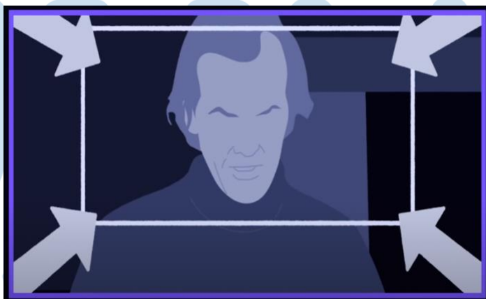
Gambar 2.12 Zoom

Zoom adalah teknik yang digunakan untuk memperbesar suatu titik fokus pada objek tertentu agar menimbulkan efek dramatis pada suatu adegan.