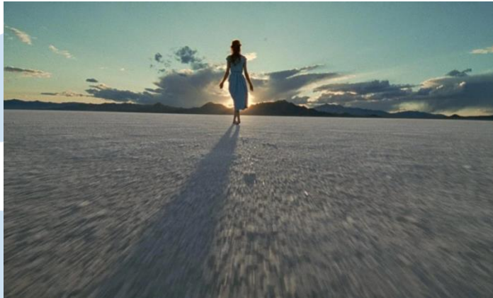
Gambar 2.4 Wide Shot