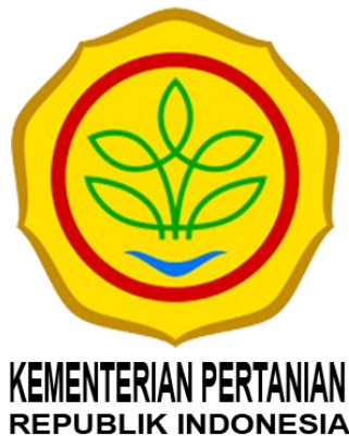
Gambar 2.1 Logo Kementerian Pertanian Republik Indonesia

Kementerian Pertanian Republik Indonesia berdiri sejak kemerdekaan negara Indonesia pada tahun 1945. Kementerian Pertanian Republik Indonesia saat itu masih menjadi departemen yang berada dibawah Kemeneterian Kemakmuran. Pada tahun 2009, Departemen Pertanian dibentuk menjadi Kementerian Pertanian Republik Indonesia yang memiliki tugas untuk menyelenggarakan urusan pemerintahan di bidang pertanian. Lembaga ini membantu Presiden untuk menyelenggarakan program kerja pemerintahan negara dalam bidang pertanian.