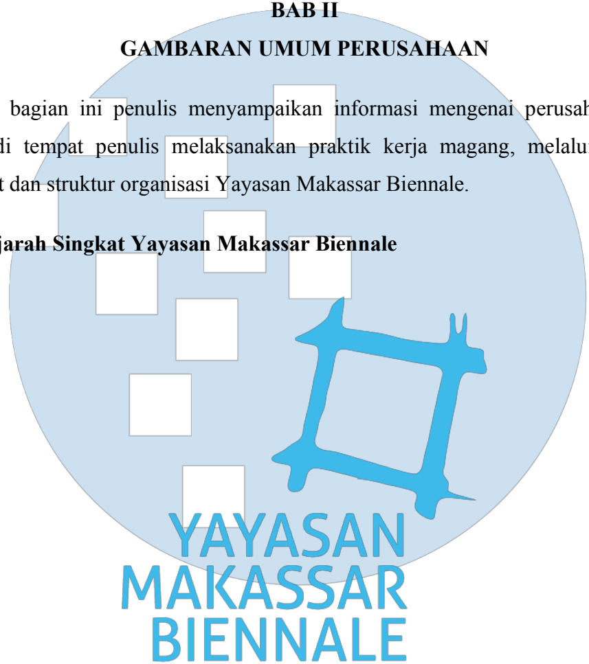
Gambar 1. Logo Yayasan Makassar Biennale

Yayasan Makassar Biennale dibentuk pada tahun 2016 oleh Tanahindie, institusi riset perkotaan di Makassar. Anwar Jimpe Rachman selaku direktur Yayasan Makassar Biennale (MB) berharap dengan adanya MB dapat membuka dialog antara seni rupa dengan dimensi kehidupan lainnya, sebagai forum dan kerja-kerja kebudayaan dengan melaksanakan serangkaian program yang bertujuan mengembangkan wacana melalui pameran, seminar, diskusi, hingga publikasi. Pada tahun 2017, MB kemudian menjadikan “Maritim” sebagai tema abadi perhelatan MB seterusnya, tema tersebut juga beriringan dengan visi dari kabinet Jokowi-JK yang hendak mengembalikan marwah Indonesia sebagai poros maritim dunia. Titik berangkatnya juga serupa, yakni kegelisahan atas sikap manusia