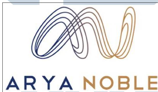
Gambar 2.1. Logo Arya Noble

Arya Noble berlokasi di Treasury Tower 36th – 37 th Floor, District 8 SCBD Jend. Sudirman Street Kav 52-53 Senayan, Kebayoran Baru, Jakarta Selatan 12190. Menurut website Arya Noble, Arya Noble merupakan perusahaan berjenis Business Innovation Studio, Investment and Strategic Holding Company . Arya Noble memegang penuh perusahaan lain di bawahnya seperti ERHA, Marco, Genero, Derma XP. Arya Noble dipecah menjadi dua jenis cakupan yaitu Arya Noble Dermatology dan Arya Noble Ventures.