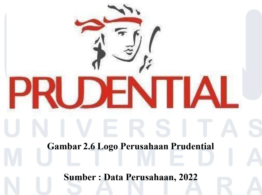
Gambar 2.6 Logo Perusahaan Prudential