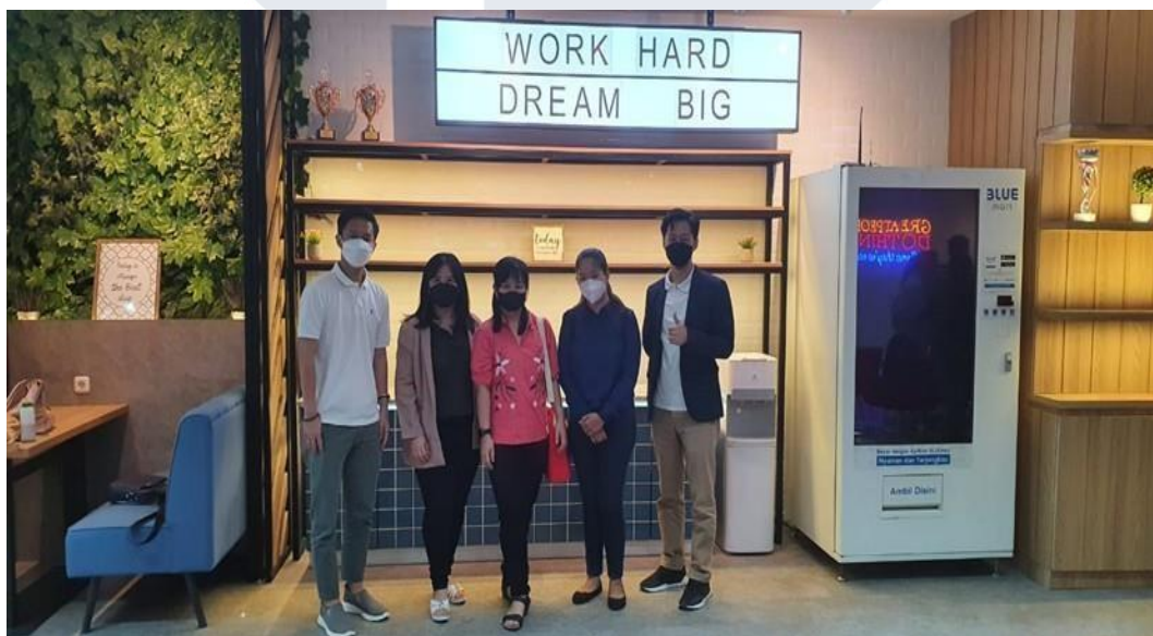
Gambar 2.2 Kantor Pemasaran GPS United

Salah satu kantor pemasar Prudential yang terbaik adalah PT. Generasi Pasti Sukses atau sering kali dikenal sebagai GPS United. GPS United sendiri telah berdiri sejak tahun 2014 dan pada tahun 2019, GPS United baru diresmikan menjadi agensi nomor 1 di Prudential. GPS United ini menyediakan layanan konsultasi asuransi profesional dengan mementingkan perencanaan keuangan untuk para nasabah asuransi. Saat ini, di GPS United sudah ada sebanyak 3000 agen yang terdaftar yang terdiri Insurance Advisor dan leader. Beberapa kantornya GPS United ada di Bandung, Padang, Semarang, dan Lampung. GPS United juga melakukan banyak kegiatan yang berfokus pada pengembangan kesuksesan generasi muda dengan membuat komunitas milenial. Komunitas pengembangan yang dibuat GPS United terdiri dari komunitas public speaking dan stock serta komunitas di bidang olahraga, seperti komunitas bersepeda, berlari, dan bulu tangkis. GPS United memiliki nilai yang bernama “Grow with Passion to Build Great People” yang bertujuan untuk menumbuhkan dan mengembangkan jiwa berbisnis.