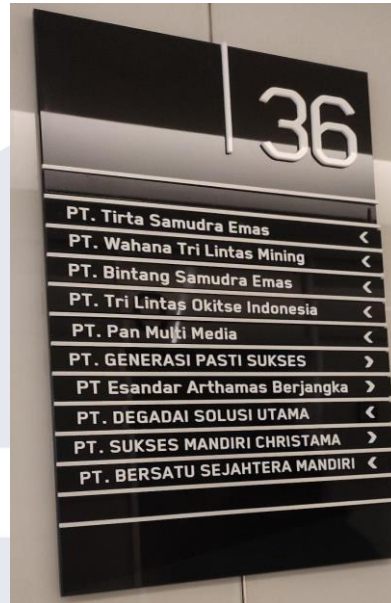
Gambar 2.4 Lokasi Kantor Pemasar PT. Generasi Pasti Sukses