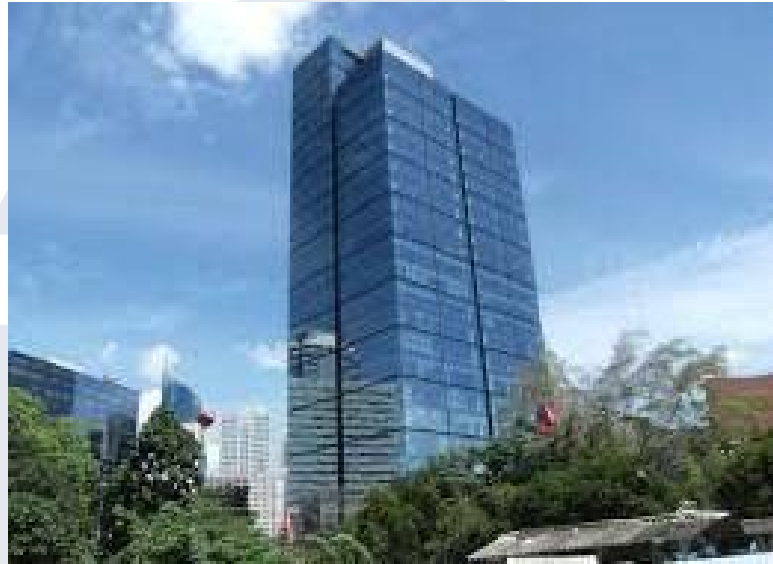
Gambar 2.3 Lokasi Perusahaan PT. Prudential Life Assurance