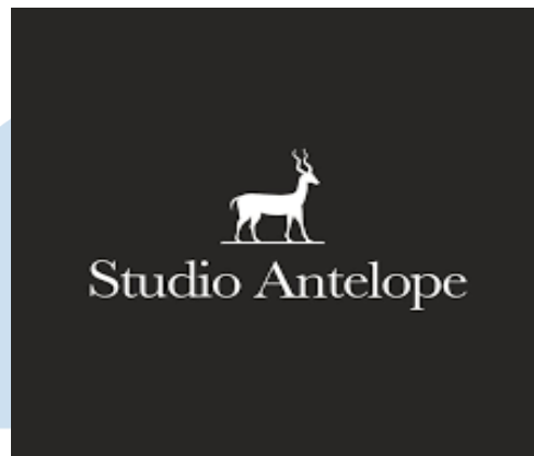
Gambar 2.1 Logo Studio Antelope