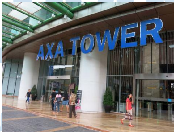
Gambar 2.1 Gedung Axa Tower lokasi kantor Multimatics di lantai 37