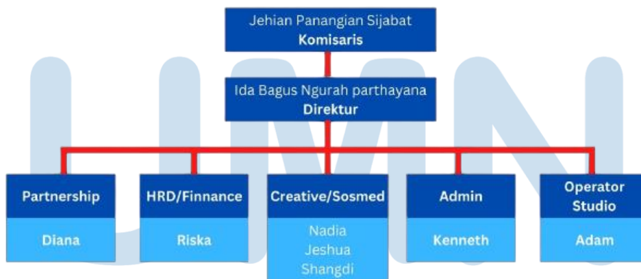
Bagan 2.2 Struktur Perusahaan Belinsky