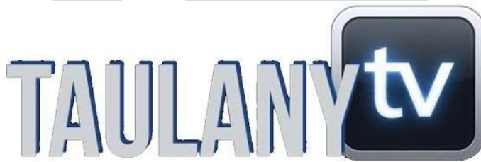
Gambar 2.1 Logo Perusahaan PT. Taulany Media Kreasi

PT. Taulany Media Kreasi merupakan perusahaan yang bergerak di industri hiburan sejak Maret 2020 sebagai rumah produksi. Taulany TV sebagai nama yang lebih dikenal dan juga dipakai sebagai nama kanal Youtube, dimiliki oleh Andreas Taulany. Sebelum menjadi perusahaan resmi, Taulany TV telah menghibur penontonnya sejak tahun 2018 melalui Youtube. Penonton dapat menikmati berbagai hiburan seperti vlog , ulasan rumah artis , ulasan otomotif , talk show , dan acara lainnya dengan pembawaan santai dengan sedikit komedi. Dengan lebih dari 800 konten video dan 6.36 juta pengikut di kanal Youtube mereka, perusahaan tersebut juga menggugah konten pada platform sosial Instagram dan Tiktok dengan nama Taulany TV.