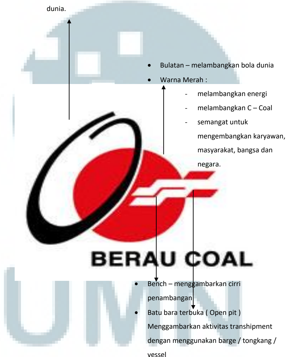
Bagan 1. Logo PT Berau Coal (PT Berau Coal, 2010)