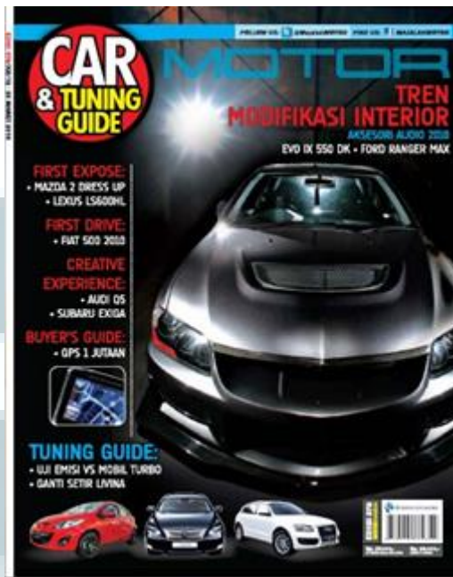
Cover majalah MOTOR ( Car & Tuning Guide)