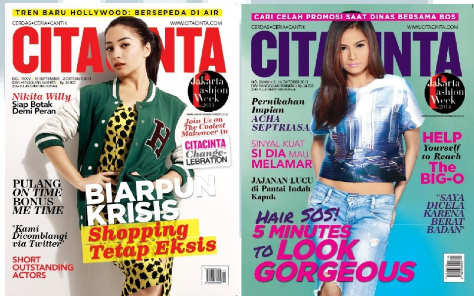
Gambar 2.2 Cover Cita Cinta No. 19/XIV dan 20/XIV