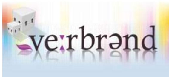
Gambar 2.6 - Logo Verbrand

Sedangkan jika digolongkan berdasarkan keahlian industry ( industry expertise ), Fortune PR terbagi kedalam tiga tim: