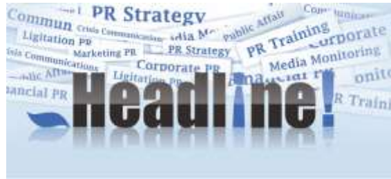
Gambar 2.2 - Logo Headline