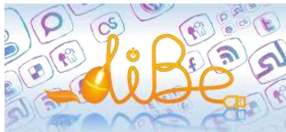
Gambar 2.3 - Logo Dibe

Dibe memberikan jasa berupa strategi digital, pembuatan dan pengembangan website perusahaan, aktivasi social media, dan aktivasi mobile.