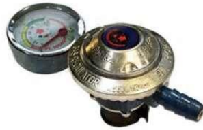
Gambar 2.1.4.1 Regulator Low Pressure Gambar 2.1.4.2 Kompor Gas 2 Tungku