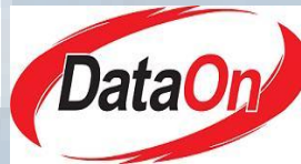
Gambar 2.1 Logo PT Indodev Niaga Internet (DataOn)

PT Indodev Niaga Internet pertama kali didirikan pada bulan Agustus 1999, dengan target membangun Application Service Providers (ASP) melalui portal aplikasi internet. Kurang dari satu tahun kemudian, DataOn bekerja sama dengan PT Indodev Niaga Internet pada bulan Februari 2000 di Jakarta, Indonesia untuk menyediakan sumber pembangunan negara yang kompetitif.