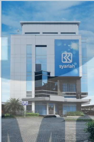
Gambar 1.1. Kantor Pusat PT. Bank BRISyariah

Sejarah PT. Bank BRISyariah menurut website perusahaan di www.brisyariah.co.id adalah berawal dari akuisisi PT. Bank Rakyat Indonesia (Persero), Tbk., terhadap Bank Jasa Arta pada 19 Desember 2007 dan setelah mendapatkan izin dari Bank Indonesia pada 16 Oktober 2008 melalui suratnya o.10/67/KEP.GBI/DpG/2008, maka pada tanggal 17 November 2008 PT. Bank BRISyariah secara resmi beroperasi. Kemudian PT. Bank BRISyariah merubah kegiatan usaha yang semula beroperasi secara konvensional, kemudian diubah menjadi kegiatan perbankan berdasarkan prinsip syariah Islam.