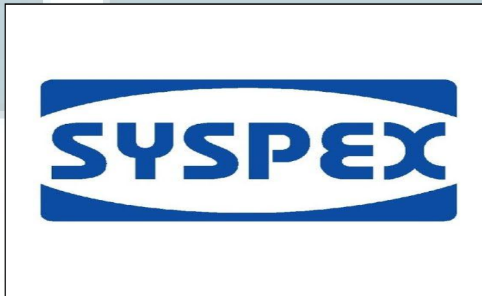
Gambar 2.1 Logo Syspex Group

Syspex Group mulai berdiri sejak tahun 1992 dengan kantor pusat yang terletak di Singapura. Syspex Group merupakan organisasi yang memprakarsai dalam menyediakan sistem kompleks bagi customer dalam menjaga produk untuk keamanan dalam perjalanan. Sekarang setelah lebih dari 20 tahun, Syspex Group menjadi yang terdepan dalam bidang penyediaan jasa solusi packaging dan warehousing . Saat ini Syspex Group memiliki 6 anak perusahaan dengan jumlah karyawan lebih dari 200 orang yang berada di 4 negara seperti Indonesia, Malaysia, Thailand, dan Singapura.