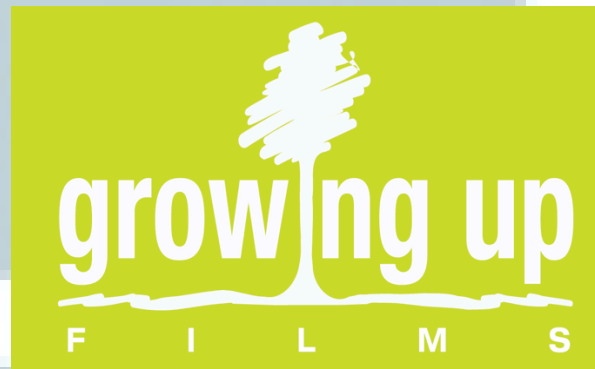
Logo Perusahaan Growing Up Films