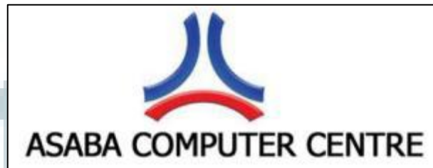
Gambar 2.1 – Logo PT. Asaba Computer Centre