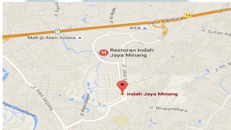
Gambar 2.3 Lokasi PT Indah Jaya Minang melalui Google Maps

Berikut cerita tentang visi dan misi serta sejarah perusahaan PT Indah Jaya Minang ini. Indonesia adalah bangsa yang tidak hanya luas dalam segi kepulauan namun juga melalui kekayaan budayanya. Terdiri dari sekitar 250 juta manusia, orang Indonesia percaya akan pentingnya membangun persahabatan dan kepercayaan dengan satu sama lain baik keluarga maupun orang lain. PT Indah Jaya Minang adalah suatu perusahaan yang bergerak dalam bidang Restoran. Yang sudah berjalan selama 48 tahun dalam bidang restoran masakan Padang yang dahulunya bernama Lapan Jaya sekarang menjadi Indah Jaya Minang.