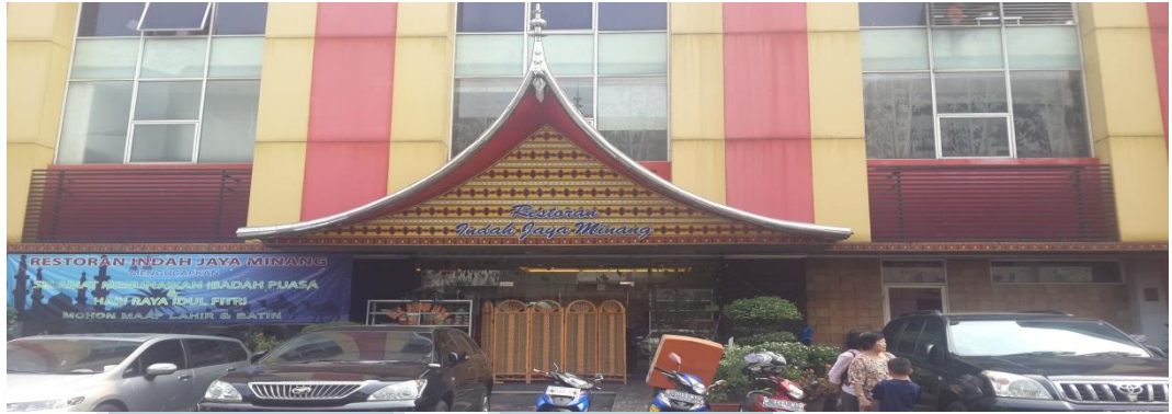
Gambar 2.2 PT Indah Jaya Minang Tampak Depan

Berikut cerita tentang visi dan misi serta sejarah perusahaan PT Indah Jaya Minang ini. Indonesia adalah bangsa yang tidak hanya luas dalam segi kepulauan namun juga melalui kekayaan budayanya. Terdiri dari sekitar 250 juta manusia, orang Indonesia percaya akan pentingnya membangun persahabatan dan kepercayaan dengan satu sama lain baik keluarga maupun orang lain. PT Indah Jaya Minang adalah suatu perusahaan yang bergerak dalam bidang Restoran. Yang sudah berjalan selama 48 tahun dalam bidang restoran masakan Padang yang dahulunya bernama Lapan Jaya sekarang menjadi Indah Jaya Minang.