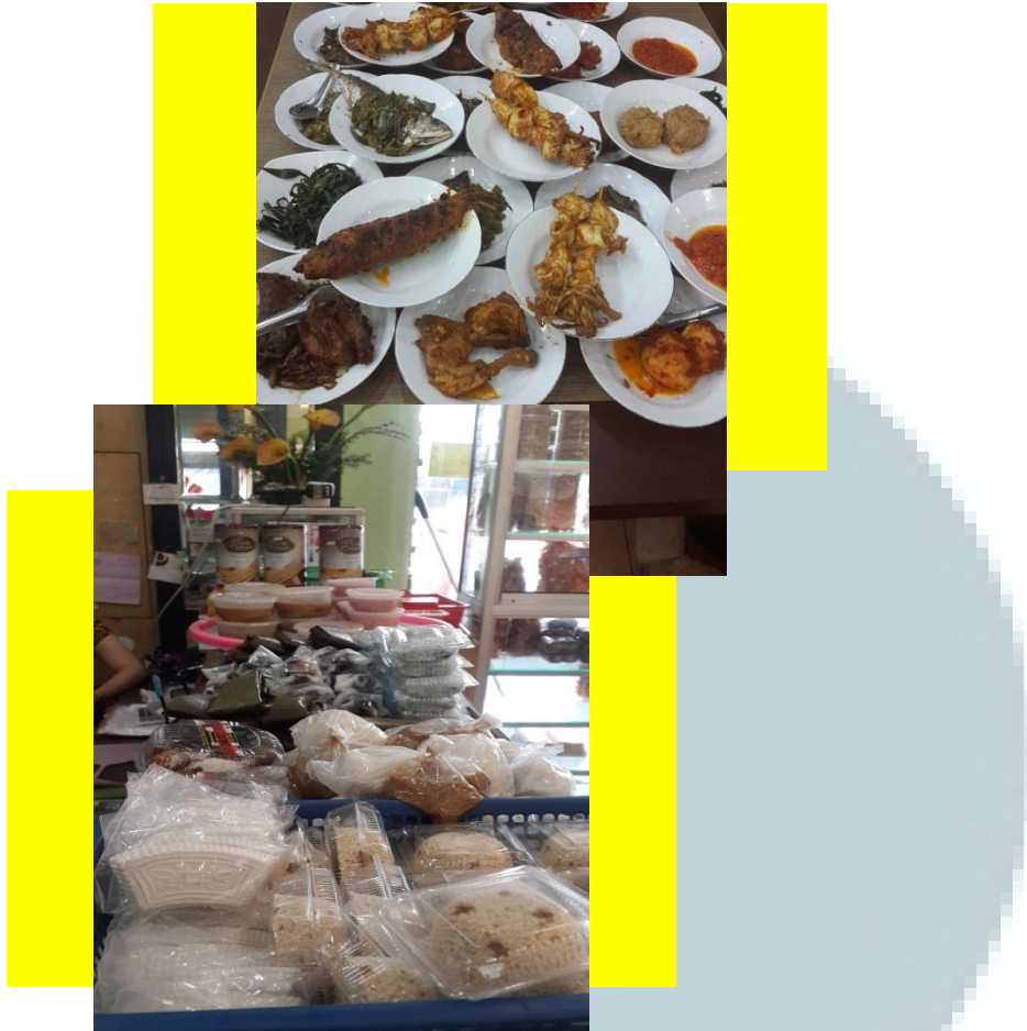
Gambar 2.5 Produk Indah Jaya Minang

Tidak terpaku pada beberapa jenis makanan saja, PT Indah Jaya Minang juga menambahkan jenis masakan sendiri yang tidak ada di restoran Padang lainnya. PT Indah Jaya Minang juga membuka kerjasama dalam bidang franchise dengan pihak mana saja yang tertarik baik pihak dalam negeri atau luar negeri. .