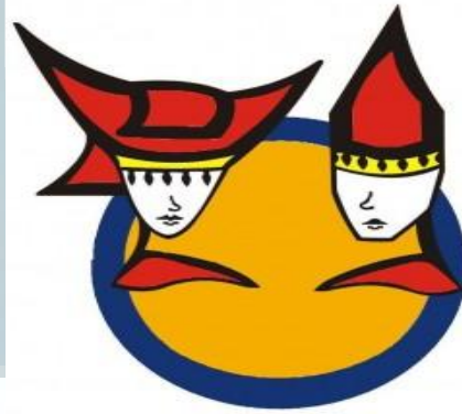
Gambar 2.1 Logo PT Indah Jaya Minang

PT Indah Jaya Minang berlokasi Komplek Ruko Imperial Walk Jalur Tol Alam Sutra 29C no 46-48 Alam Sutra Tangerang, digunakan sebagai tempat meeting dengan corporate , atau disebut dengan showcase , dimana di tempat itu menjadi tempat menaruh contoh-contoh barang yang diproduksi. Sedangkan N 39, digunakan sebagai kantor utama, serta gudang, dimana seluruh proses produksi dilakukan.