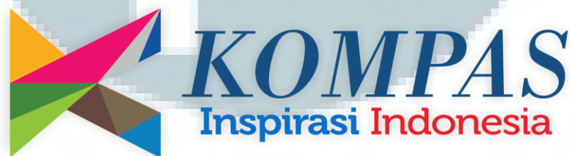
Gambar 2.1: Logo KOMPASTV