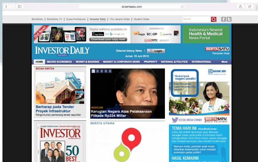
Gambar 2.3 Laman situs web Investor Daily Indonesia