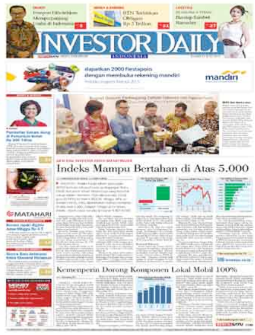
Gambar 2.2 Surat Kabar Investor Daily