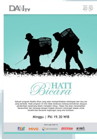
Gambar 2.2 Logo Program “Hati Bicara”