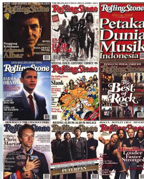
2.1.1 Berbagai Cover Majalah RSI