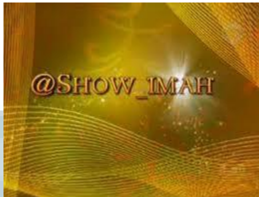
Gambar 2.8. Juara 1