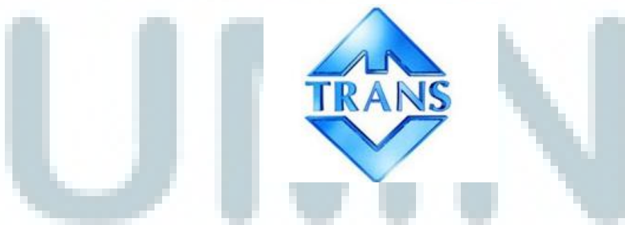
Gambar 2.1. Logo Lama Trans TV

Logo Trans TV berbentuk berlian, yang menandakan keindahan dan keabadian. Kilauannya merefleksikan kehidupan dan adat istiadat dari berbagai pelosok daerah di Indonesia sebagai simbol pantulan kehidupan serta