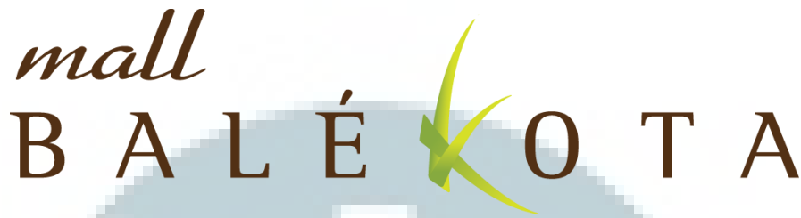
Gambar 2.1 Logo Mall Balekota