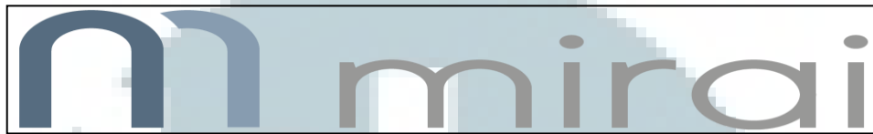
Gambar 2.1 Logo PT Mirai Internasional Indonesia

Gambar 2.1 merupakan logo perusahaan PT Mirai Internasional Indonesia yang telah berdiri sejak tahun 2013.