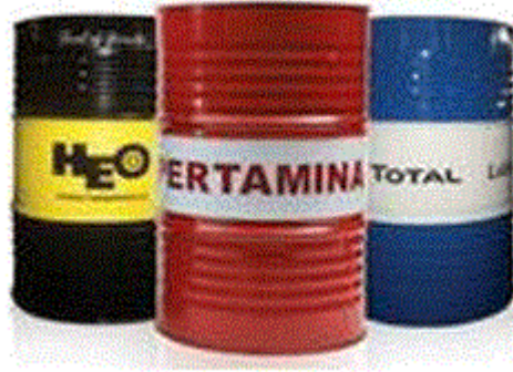
Gambar 2.2 Beberapa produk Drum ( steel drum ) yang di produksi

dengan Pertamina saja, beberapa perusahaan lain milik swasta juga mempercayakan pembuatan drum kepada PT Pelangi Indah Canindo Tbk seperti PLI, Castrol, Total dan lain sebagainya.