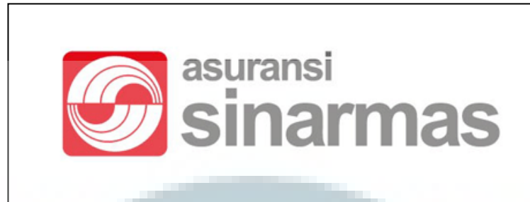
Gambar 2.1 Logo PT Asuransi Sinarmas