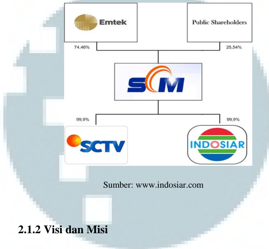
Gambar 2.2 Struktur Korporasi

dikuasai oleh SCM pasca bergabung dengan IDKM dan "bersaudara" dengan SCTV. Dengan penggabungan tersebut, IDKM melebur ke dalam SCM, selanjutnya SCM menjadi induk perusahaan Indosiar terhitung sejak 1 Mei 2013.