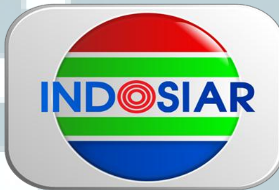
Gambar 2.1 Logo Indosiar