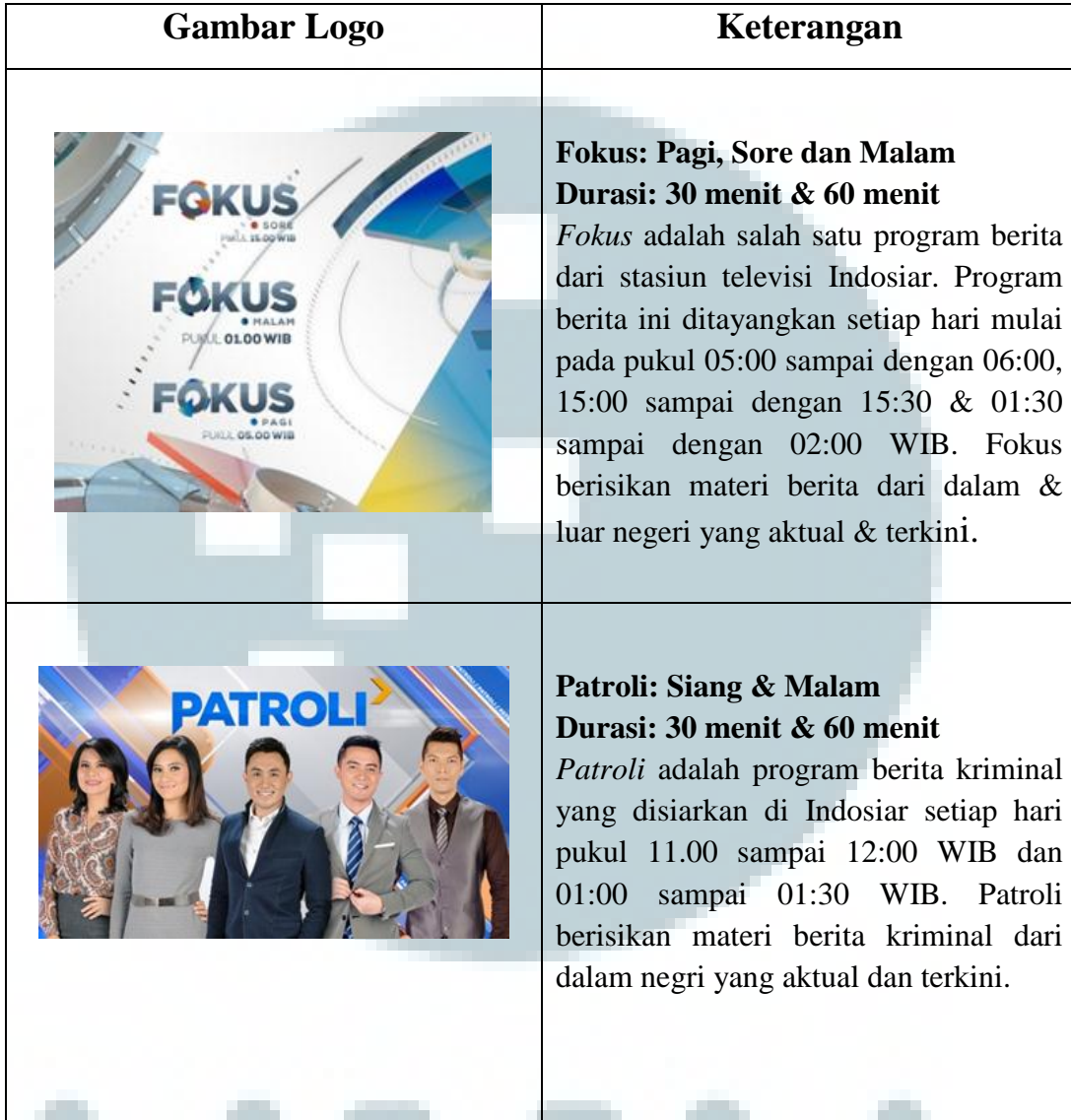
Tabel 2.1 program news Indosiar