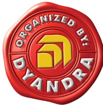
Gambar 2.2 Logo PT. Dyandra Promosindo